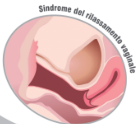
Sindrome del rilassamento vaginale